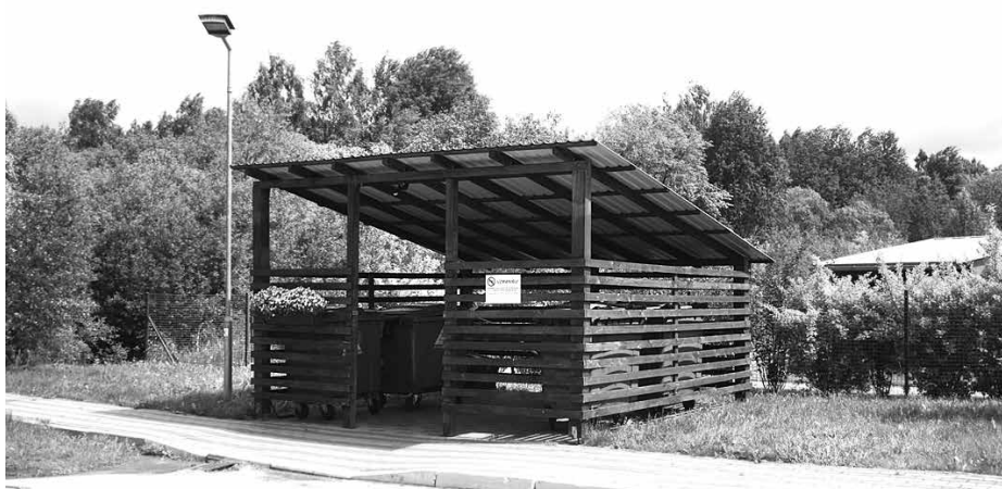
Slēgta tipa atkritumu novietņu izveidei pieejams pašvaldības līdzfinansējums

Palielinoties valsts noteiktajam dabas resursu nodoklim, līdz 2020.gadam Latvijā būtiski pieaugs maksa par nešķiroto sadzīves atkritumu apsaimniekošanu, tādēļ iedzīvotājiem savlaicīgi jāuzsāk atkritumu šķirošana. Šķirojot atkritumus un pārstrādājot otrreiz izmantojamus materiālus – papīru, plastmasas pudeles un stiklu –, būtiski iespējams samazināt atkritumu poligonos apglabājamo atkritumu daudzumu. Līdz 2020.gadam šķiroto atkritumu apjomu novadā plānots palielināt no pašreizējiem 10% līdz 70% no kopējā sadzīves atkritumu apjoma. Lai veicinātu nešķiroto sadzīves atkritumu apjoma samazināšanos, Siguldas novadā plānots uzlabot un papildināt šķiroto atkritumu apsaimniekošanas sistēmu, ieviešot bioloģisko (pārtikas) atkritumu konteinerus un izbūvējot zaļo un dārza atkritumu kompostēšanas laukumu, piemēram, koku lapām, zālei un augļiem. Jaunajos noteikumos noteiktās prasības attiecībā uz bioloģisko atkritumu apsaimniekošanu stāsies spēkā ar brīdi, kad atkritumu apsaimniekotājs – PSIA „Jumis” – būs ieviesis bioloģisko atkritumu apsaimniekošanas sistēmu un izbūvējis zaļo un dārza atkritumu kompostēšanas laukumu.