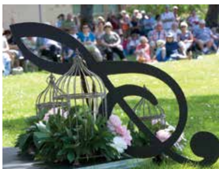
Jūlija svētdienu rītos notiks par tradīciju kļuvušās Muzikālās brokastis