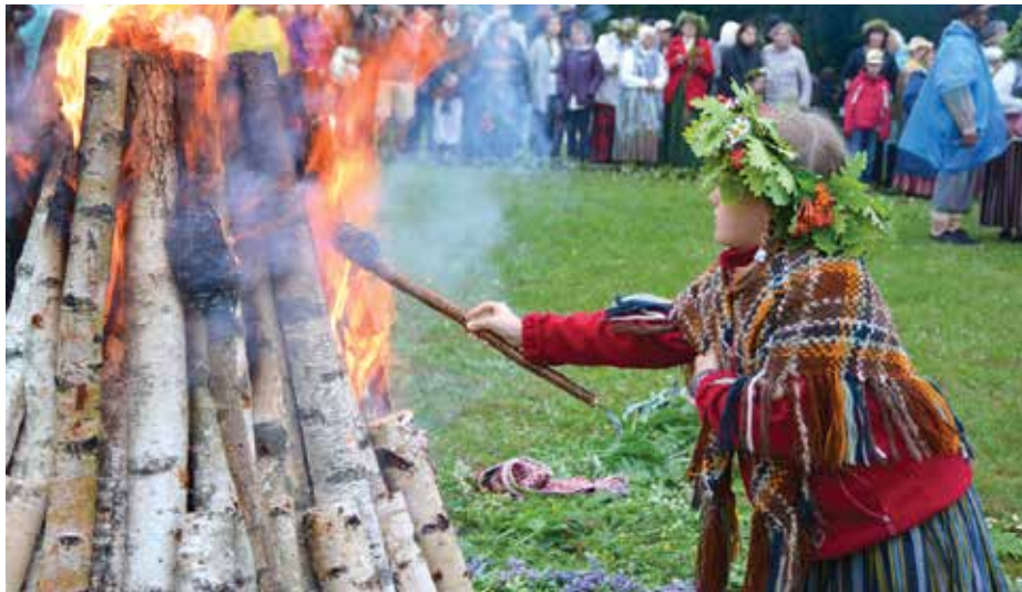
Ar plašu pasākumu programmu visā Siguldas novadā tiks svinēti vasaras saulgrieži

21.jūnijā no plkst.19.00 Turaidas muzejrezervātā jau vienpadsmito gadu tiks svinēti vasaras saulgriežu svētki. Šajā gadā Jāņa bērnu sagaidītāju Turaidā būs īpaši daudz – no Latgales, Kurzemes, Vidzemes, Zemgales un Rīgas sabrauks līgotāji, lai izdziedātu savas Jāņu dziesmas, dalītos ar Jāņu tradīciju zināšanām un sagaidītu sauli, gatavojoties Latvijas simtgades lielajam notikumam – starptautiskajam folkloras festivālam